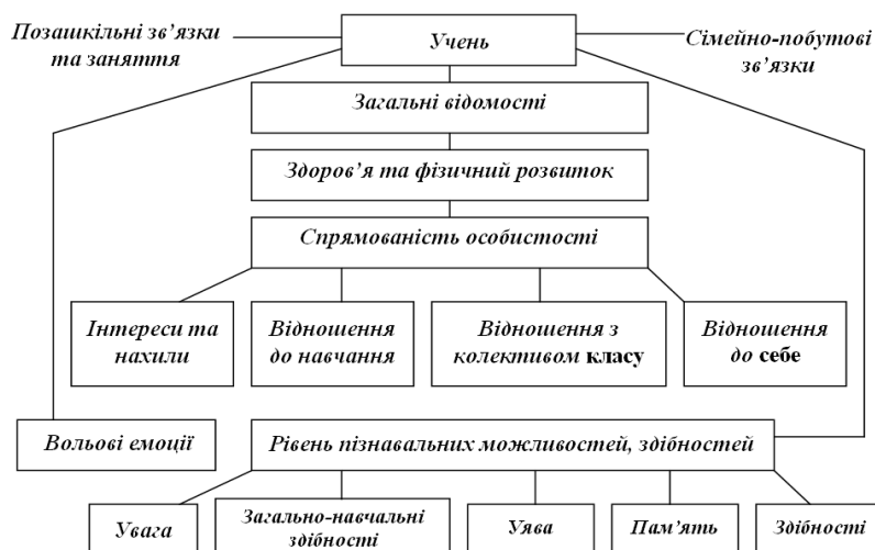
Рис. 2. Схема вивчення особистості школяра

Велика зацікавленість учнів виявляється до гуртків естетичного та історико-краєзнавчого спрямування. Діяльність кожного гуртка, який працює в школі має здійснюватись цілеспрямовано, заняття сприяти самореалізації учнів, допомагати розкрити приховані здібності. Під час гурткової роботи діти мають можливість займатися аматорською виконавською діяльністю, відродженням традицій народно-побутового мистецтва, залучаються до художньої творчості, мають змогу самореалізуватися і займатися творчим самовдосконаленням.