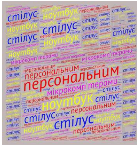
Рис 3. «Хмара тегів» розроблена до уроку «Комп'ютери бувають різні»