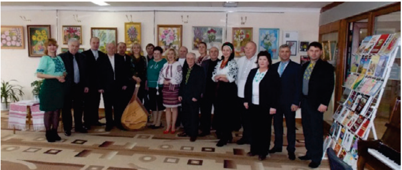
Керівництво Рівненського відділення Національної музичної спілки, 2017 р.

У творчій структурі спілки 17 жанрово-галузевих асоціацій та 28 територіальних осередків у всіх регіонах України. Зокрема, це такі асоціації, як Хорове товариство ім. М. Леонтовича, Асоціація діячів духової музики, Товариство діячів естрадного мистецтва, діячів музичної освіти і виховання, діячів хореографічного мистецтва тощо. Членами спілки є майже дві тисячі професійних діячів музичного мистецтва України. Більшість із них є керівниками концертних організацій, оркестрів, музичних навчальних закладів, творчих кафедр, що дає їм можливість активно впливати на громадську думку, вести єдину національну культурну політику серед усіх верств населення.