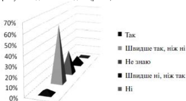
Рис. 2. Задоволеність якістю харчування студентів другого курсу

Результати оцінювання задоволеністю якістю харчування студентами другого курсу Рівненського державного гуманітарного університету допомогли визначити вплив харчової поведінки на якість життя в контексті особливостей суб'єктивної оцінки. 75 % студентів отримали задоволення від їжі, 10 % вагаються з відповіддю, 15 % – швидше не отримують, ніж отримують задоволення від їжі (рис. 2).