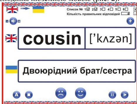
Рис. 1. Аудіовізуальний образ, за допомогою якого суб'єкт навчання вивчає слова в розділі «Тренажер»

Засіб віртуальної наочності надає можливість суб'єктам навчання: формувати та закріплювати граматичні, фонетичні та лексичні навички, активізувати мовну діяльність, відпрацьовувати й аналізувати вимову, вивчати нові слова (рис. 1), вести діалог та монолог, контролювати та тестувати власні знання і вміння щодо володіння іноземною мовою (рис. 2).