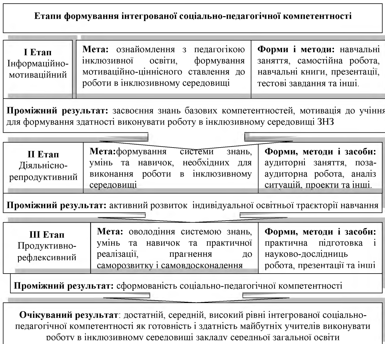
Рис. 1. Модель процесу формування інтегральної соціально-педагогічної компетентності у майбутніх учителів початкових класів ЗЗСО до організації інклюзивного навчання.

Визначені етапи мають конкретні завдання, як-от: