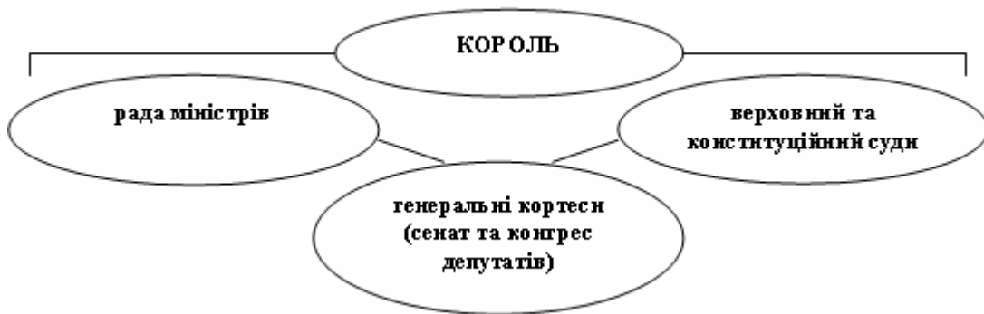
Рис. 3. Структурна схема головних державних органів влади в Іспанії за Конституцією 1978 року

У системі розподілу влад по горизонталі (Див. Рис.3) парламент Іспанії посів значне місце, оскільки саме він став двопалатним представницьким органом, що почав приймати закони, формувати уряд або ж висловлювати йому недовіру, приймати бюджет країни, ратифікувати міжнародні договори, вирішувати питання війни та миру.