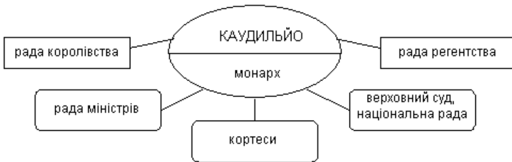
Рис. 1. Структурна схема головних державних органів влади в Іспанії у період правління генерала Франко

Органи державної влади в Іспанії за часів франкістського режиму не мали чіткої стабільної окресленості у цих конституційно-правових актах. І протягом усього правління Франко державна система функціонувала не за зразками світових державно-політичних систем, а за суб’єктивним розумінням генерала (Див. Рис. 1).