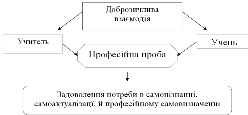
Мал.1. Схема інтерактивної взаємодії в процесі педагогічної підтримки професійного самовизначення учнів 8-9 класів

Враховуючи генезис становлення методу професійних проб з точки зору професійної консультації, профільного навчання та технологій педагогічної освіти приходимо до висновку, що професійна проба – основна форма професійного самовизначення учнів. Метод професійних проб – сучасна нетрадиційна педагогічна технологія особистісно орієнтованого навчання спрямована на виявлення кожним учнем профілю (професії) для подальшого опанування нею, що активізує процес професійного самовизначення учнів.