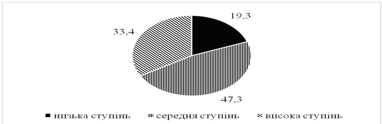
Рис. 2. Розподіл студентів з преконвенційним рівнем моральної свідомості (%)

розвитку моральної свідомості. Водночас усі студенти також володіють попередньою стадією преконвенційною, розподіл студентів на цій стадії моральної свідомості відображено на рисунку 2.