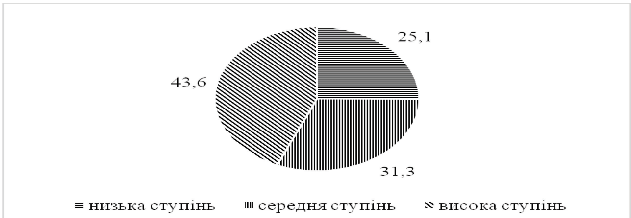
Рис. 3. Розподіл студентів з конвенційним рівнем моральної свідомості

Розподіл студентів на конвенційній стадії морального розвитку (див. рис. 3) має подібний вигляд до преконвенційної стадії. Так, найвищий відсоток студентів (43,6%) охоплює також високу ступінь конвенційної моральної свідомості. Студенти із цією стадією моральної свідомості підпорядковуються прийнятим моральним вимогам і прагнуть відповідати моральним очікуванням групи (сім'ї, трудового колективу, організації, нації тощо). Провідним гаслом цих студентів є підпорядкування законам і порядку.