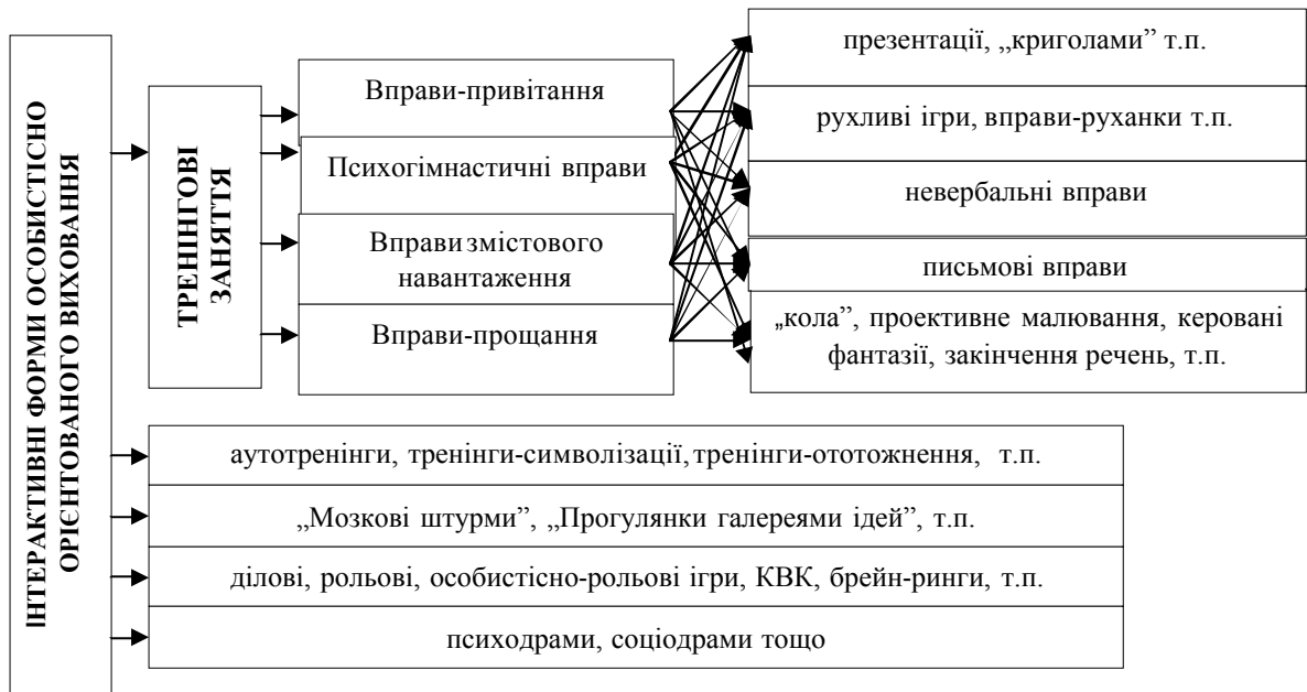
Рис. 1. Інтерактивні форми практичної реалізації інваріантів особистісно орієнтованого підходу до виховання

їхню особистісну цінність та суспільну значущість [3; 4; 9, 34]. Під час проведення тренінгових занять самосприйняття і самовираження особистості здійснюється у процесі активної взаємодії з іншими людьми. Вихованець вчиться розуміти і сприймати свою особистість: через співставлення себе з іншими; сприйняття його ними через результати власної діяльності; спостереження свого внутрішнього стану; сприйняття зовнішнього образу, „Я”-фізичного.