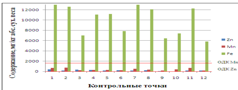
Рисунок 2 – Среднее содержание цинка, марганца, железа в слоевищах лишайников, мг/кг абс. сух. веса

Наибольшее среднее содержание свинца отмечено в пробе из г. Дятькова. Место отбора пробы – посадка рядом с ОАО «Дятьковский хрустальный завод» (ОАО «ДХЗ»). Неотъемлемым компонентом при производстве хрустала является окись свинца (PbO). Также высокое содержание свинца, по сравнению с другими пробами, отмечено в пробе из старого парка, рядом с которым до 2006 г., находились основные производственные площади ОАО «ДХЗ». Помимо свинца в хрусталь добавляют мышьяк, цинк, медь, их содержание также высоко в пробах с территорий, прилегающих к ОАО «ДХЗ».