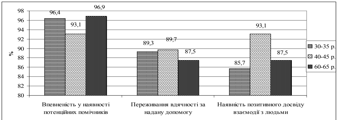
Рис. 3. Показники позитивного досвіду соціальної взаємодії дорослих

партнери вбачають у них ці якості. Дорослість виокремлюється більшістю опитаних як найінтенсивніший період просоціальної самореалізації (у підгрупах 30-35 р. та 40-45 р. у межах 81,3 % – 80 %; у підгрупі 60-65 р. – 60,6%). Професійна діяльність і сімейне життя сприймаються в усіх вікових підгрупах як чинники інтенсифікації просоціальності (83,5% та 80,7% респондентів відповідно). Результати дослідження засвідчили, що респонденти мають позитивну просоціальну історію не лише як суб'єкти, а й реципієнти допомоги.