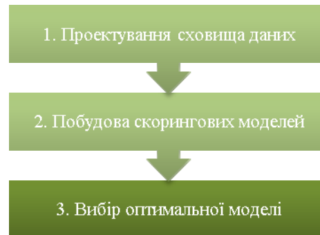
Рис. 2. Етапи побудови скорингової моделі.

Порівнюючи вищезазначені системи визначення класу позичальника, хотілося б зазначити, що західні системи частково враховують специфіку українського ринку кредитування і коштують дорожче ніж системи власної розробки. Також закордонні системи є закритими, тому при спробі адаптувати скорингову модель до нових економічних умов банк буде змушений звернутись до виробника чи постачальника даного ІТ-продукту. Як бачимо, впроваджувати скорингову систему власної розробки вигідно не тільки з фінансового, а й з функціонального погляду.