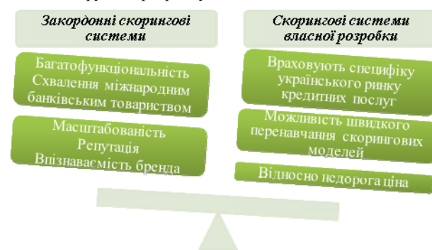
Рис. 1. Переваги скорингових систем.

Проте, яку скорингову систему впровадити в банку: довіритись західним розробникам з багаторічним досвідом, чи доручити розробку системи власним спеціалістам?