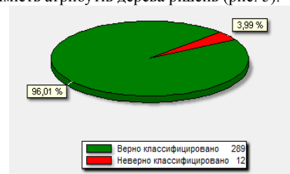
Рис. 6. Діаграми якості класифікації неймережі.

Як видно з рисунка 5, при визначенні класу позичальника дерево рішень знехтувало рядом вхідних параметрів, що є не досить добре. Деякі з даних параметрів є дуже важливі при визначенні класу позичальника, а тому нехтувати ними неможна.