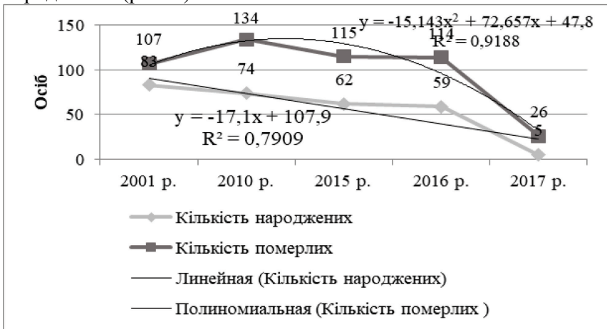
Рис. 2. Динаміка кількості народжуваних та померлих (2001-2017 рр.) на території Козинської ОТГ

Невтішною виглядає демографічна ситуація у громаді стосовно абсолютних показників народжуваності та смертності населення. Дослідження показали, що кількість померлих осіб протягом 2001-2017 рр. значно переважає над кількістю народжених (рис. 2).