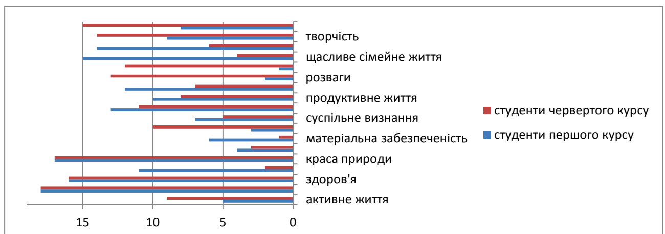
Рис. 1. Термінальні цінності (за методикою дослідження ціннісних орієнтацій М. Рокіча)

Виклад основного матеріалу. З метою вивчення психологічних особливостей ціннісних орієнтацій студентів-психологів було проведено емпіричне дослідження. Воно здійснювалось в Рівненському державному гуманітарному університеті та охопило 50 осіб (25 студентів що навчаються на першому курсі та 25 студентів четвертого курсу). Була використана методика дослідження ціннісних орієнтацій М. Рокіча. Результати емпіричного дослідження подано на рисунку 1. У студентів першого курсу домінуючими є такі цінності: свобода, розваги, хороші друзі, любов, активне життя. Це пояснюється зміною соціальної ситуації – значна частина студентів приїздить на навчання в інше місто, живе в гуртожитку, опиняється поза звичним контролем батьків, що і зумовлює вихід на передній план цінності «свобода». Студент отримує змогу сам розпоряджатися власним життям, контролювати свій розпорядок дня, фінансові витрати тощо, що зумовлює актуалізацію цінності «розваги», оскільки значна частина респондентів прагне надолужити час, коли ці сфери контролювались батьками. Також студентський період сприймається опитуваними як сприятливий час для того, щоб завести багато нових знайомств та побудувати міцні дружні стосунки, що зумовлює вихід на передній план цінності «хороші друзі». Домінуючою також стає цінність «любов», що зумовлюється орієнтацією юнаків на побудову інтимних стосунків з партнером.