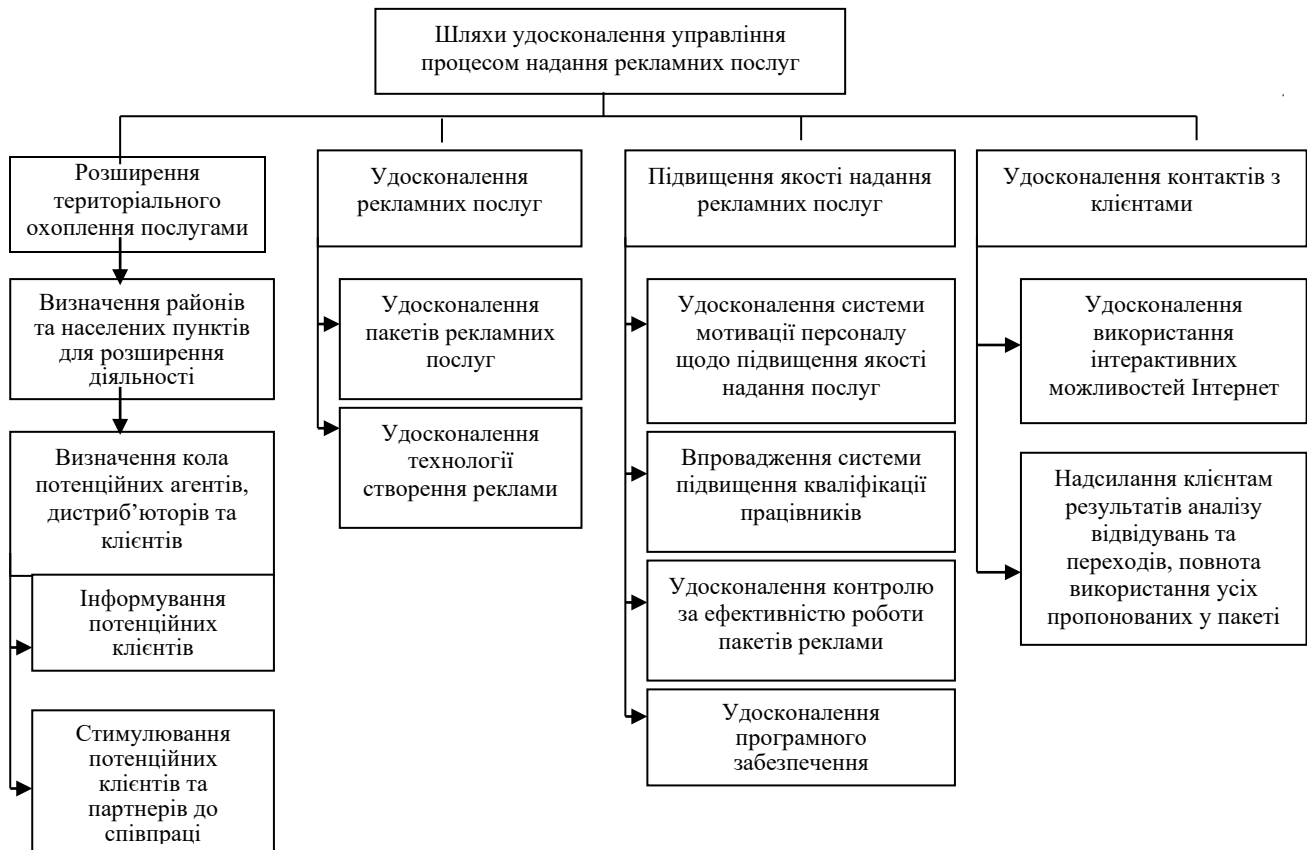
Рис.1. Шляхи удосконалення управління процесом надання рекламних послуг ПП «Українські Інтернет технології»