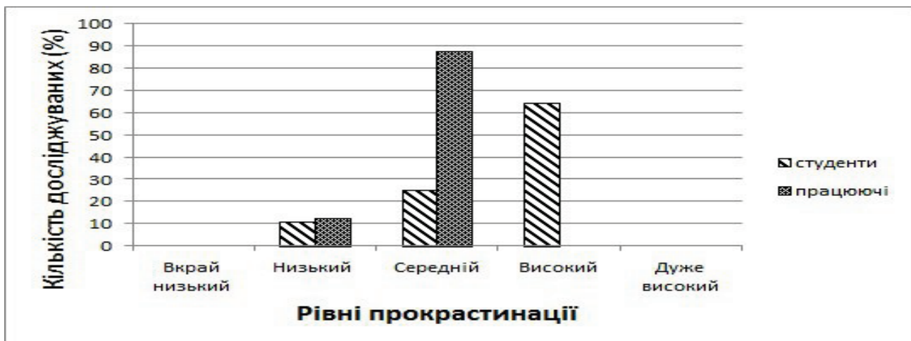
Рис. 1. Співвідношення рівня прокрастинації у студентів і працюючих.

Значних гендерних відмінностей прояву прокрастинації аналіз результатів дослідження не виявив, отже можна припускати, що прояви прокрастинації найбільше обумовлені особистісними особливостями, ніж гендерною приналежністю. Дослідження рівня прокрастинації у студентів і працюючих виявили, що високі значення прокрастинації отримали студенти, тоді як жоден працюючий юнак не потрапив у дану категорію (рис. 1).