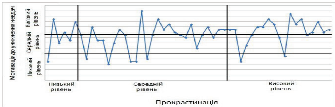
Рис.4. Співвідношення результатів прокрастинації та мотивації до уникнення невдач

За результатами можна констатувати встановлення зв'язку між мотивацією до уникнення невдач і прокрастинацією (рис.4).