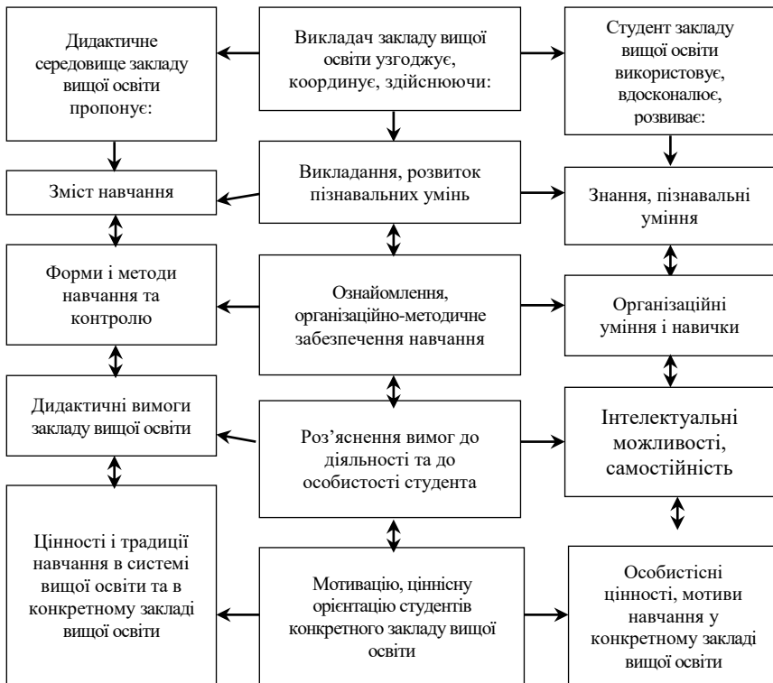
Рис. 2. Модель дидактичної адаптації студентів до умов навчання в закладі вищої освіти за наявності педагогічного сприяння

Виходячи зі змісту наведеної моделі, у структурі педагогічного сприяння дидактичній адаптації майбутніх вихователів можна виокремити змістовий, організаційно-методичний та мотиваційно-смісловий компоненти, реалізації яких може сприяти ознайомлення з навчальним курсом «Вступ до спеціальності».