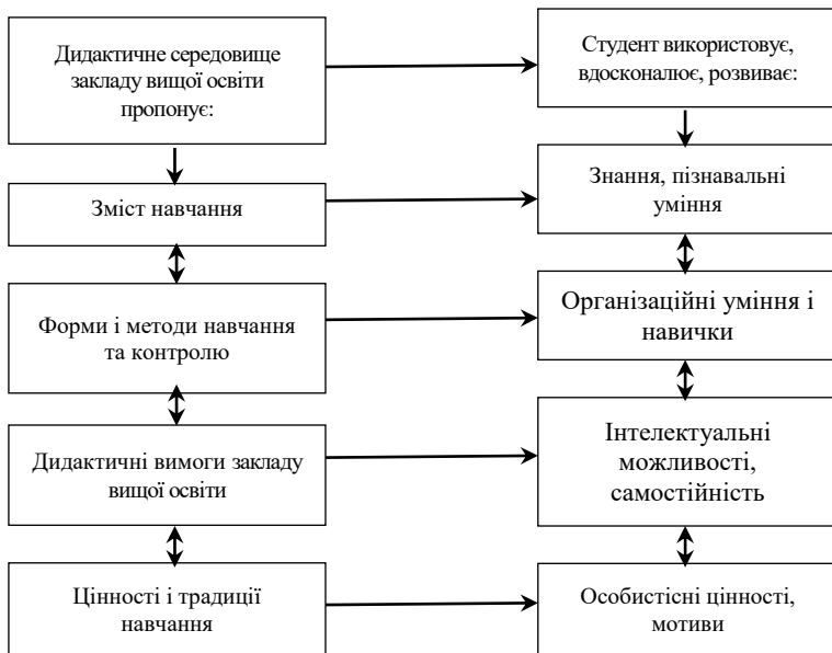
Рис. 1. Модель дидактичної адаптації студентів до умов навчання в закладі вищої освіти

Відтак сенс педагогічного сприяння дидактичній адаптації студентів полягає, на наш погляд, в реалізації посередницької місії між умовами дидактичного середовища і студентом, а передусім: у сприянні виробленню досвіду навчання у закладі вищої освіти та вдосконаленню системи необхідних для цього особистісних властивостей; у певному коригуванні (у разі необхідності) умов дидактичного середовища, зняття невідповідності між цими умовами і можливостями студентів.