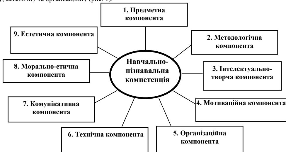
Рис. 1. Структурно-змістова модель навчально-пізнавальної компетенції.

Якщо розглядати навчально-пізнавальну діяльність як часово-просторову модель наукового пізнання, то за аналогією з науковим пізнанням [2] необхідно виділяти принаймні два його рівні – емпіричний і теоретичний. Це стосується насамперед методологічної компоненти в структурі навчально-пізнавальної компетенції. Крім методологічної компоненти, яка включає в себе певну систему компонент нижчого рівня ієрархії, необхідно виділити такі компоненти: предметну, мотиваційну, інтелектуально-творчу, технічну, комунікативну, морально-етичну, естетичну та організаційну (рис. 1).