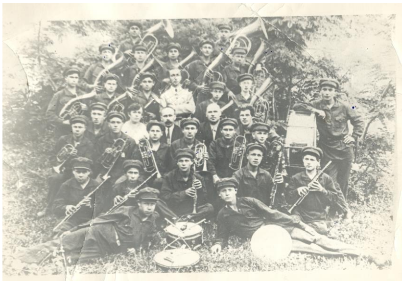
Духовий оркестр Охтирського дитячого містечка