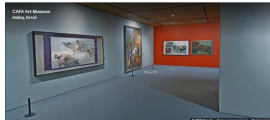
Рис.4. Віртуальна подорож «CAFA Art Museum» Beijing, Кунай

Безперечно, що кожен музей має свої унікальні колекції живопису, скульптури, графіки, археологічних знахідок, прикладного мистецтва тощо. І наразі ми маємо унікальну можливість здійснювати віртуальні подорожі з метою реалізації, в певній мірі, своїх потреб в подорожах, економії коштів, ознайомитися з будь-якою частинкою нашої планети тощо.