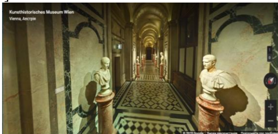
Рис.3. Віртуальна подорож «Kunsthistorisches Museum Wien» Vienna, Австрія

Світові музеї теж відкрили онлайн-доступ до своїх експозицій. Ми пропонуємо заглянути у Google Arts & Culture, де розміщено понад 1200 віртуальних екскурсій (рис.3. і рис.4) [6].