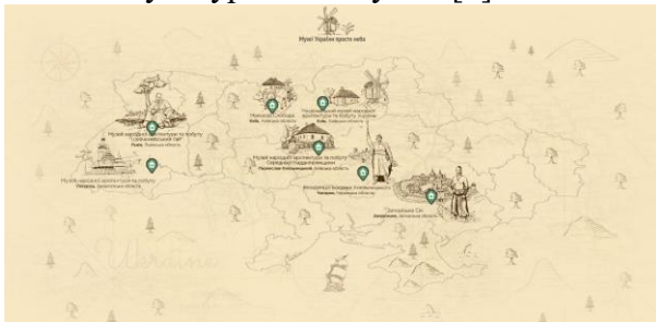
Рис 1. Портал «Музеї України просто неба»

Цей вид туризму досить різноманітний, оскільки надає можливості, як просто переглядати фотографії, так і брати участь у віртуальних екскурсіях. Досить цікавими є віртуальні подорожі музеями. Зокрема, хочемо відмітити портал «Музеї України просто неба», де можна віртуально відвідати сім автентичних музеїв (рис. 1. і рис. 2.) познайомившись з українською культурою і побутом [2].