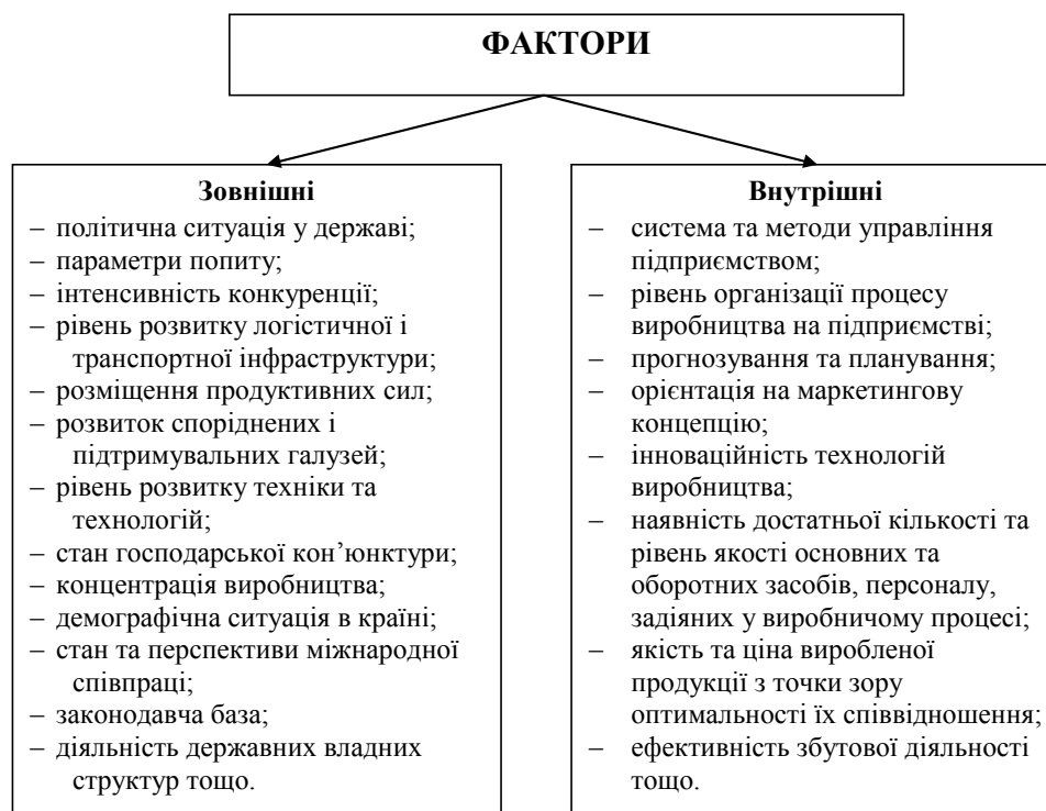
Рис. 1. Фактори впливу на конкурентоспроможність / конкурентоздатність підприємства

Рекомендується поділяти зовнішні фактори на мікро- та макрофактори. Справедливо вважається, що «підприємство на макрофактори впливати не може і в своїй господарській політиці сприймає їх як дещо незмінне... До зовнішніх мікрофакторів відносять ефективність комунікацій із споживачами, постачальниками, обрештованість цінової та збутової політик підприємства тощо» [6, с. 63].