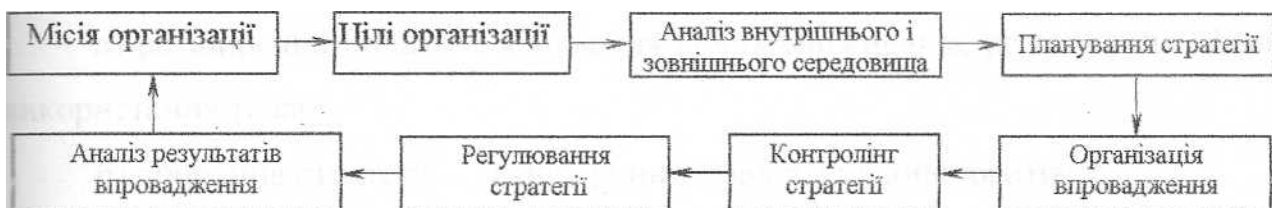
Рис. 2.1. Процедура стратегічного управління

3. Процедура діяльності - послідовність та змістовне наповнення основних функцій управління на різних його рівнях (рис. 2.1).