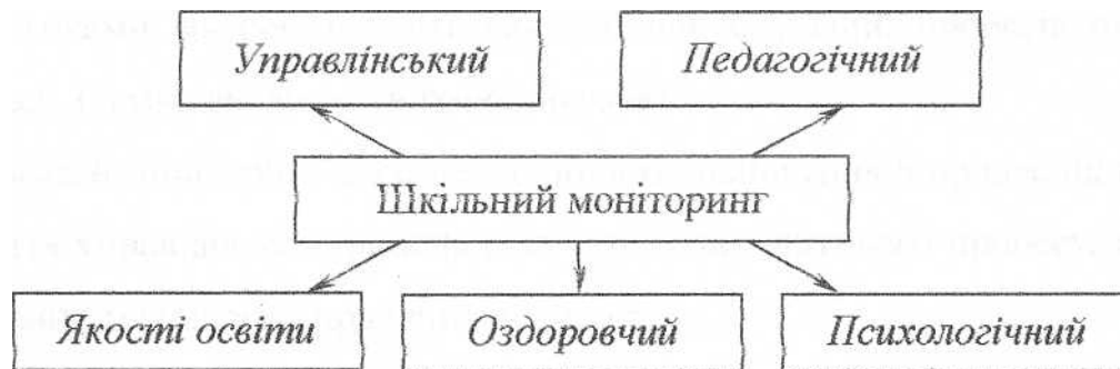
Рис. 1.2. Складові шкільного моніторингу загальноосвітнього навчального закладу

Внутрішкільне управління базується на основі використання системи шкільного моніторингу навчального закладу (рис. 1.2).