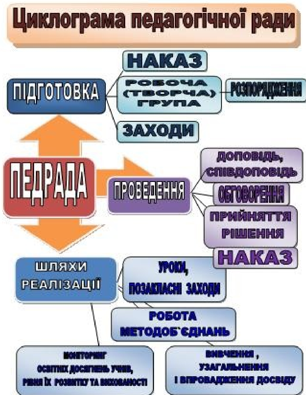
Рис. 3.1. Циклограма педагогічної ради у навчальному закладі

Саме така схема допомагає правильно організувати та спланувати роботу, що сприятиме ефективному проведенню як самого засідання педагогічної ради в навчальному закладі, так і вплине на ефективність виконання рішень.