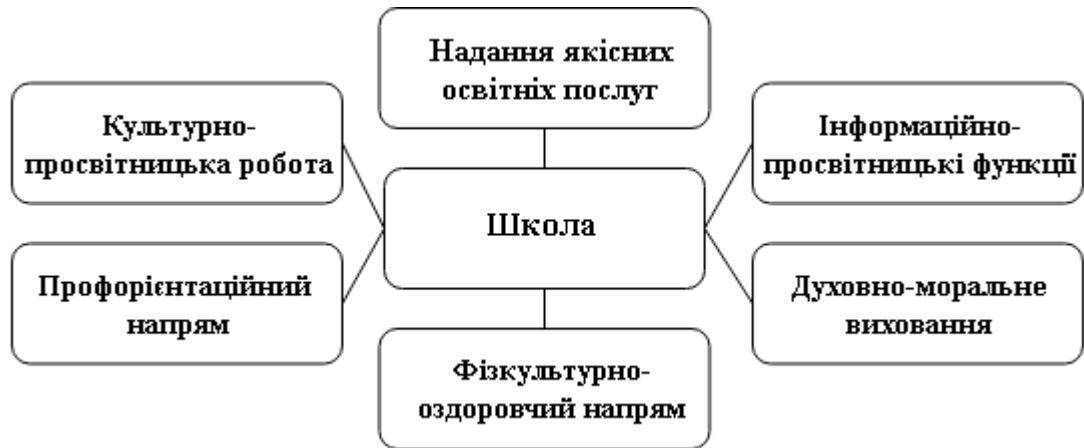
Рис. 5. Напрями діяльності школи у проекції на громаду

Безумовно, в основі громадської довіри – надання якісних освітніх послуг . Цього очікують від школи і батьки учнів, й усі свідомі громадяни, які пов’язують з якістю освіти майбутній добробут держави.