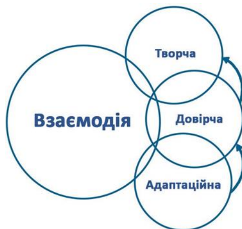
Рис. 3.Етапи розвитку партнерської взаємодії

Виділяють дванадцять етапів створення партнерства: оцінка ситуації, визначення партнерів, побудова взаємодії, планування управління, забезпечення ресурсів, реалізація, вимір результатів, оцінка, коригування і доопрацювання, створення інституційної основи, продовження або завершення [54].Л. Калініна та Н. Лісова виділяють три етапи розвитку відносин між суб'єктами у процесі налагодження механізму соціального партнерства [20](див. Рис. 3).