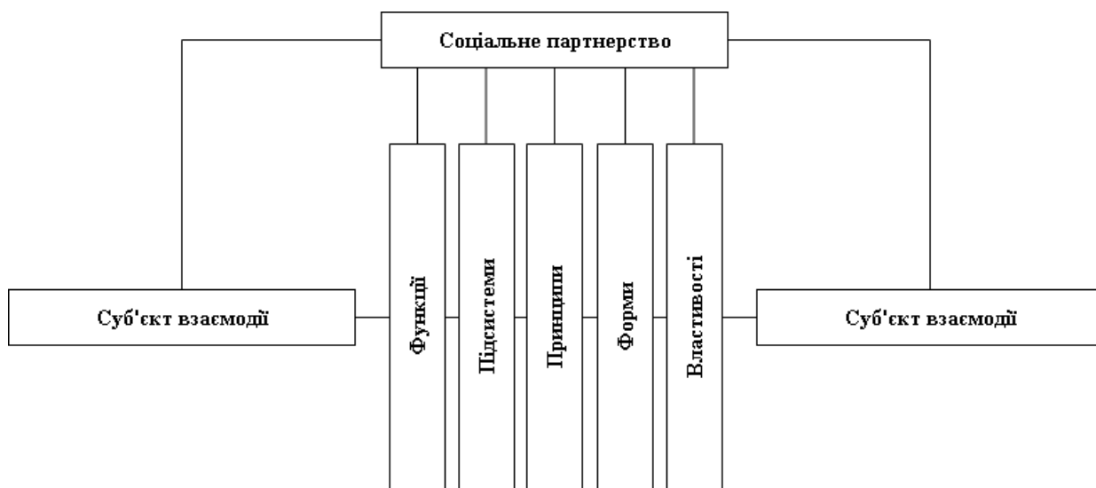
Рис. 1. Механізм соціального партнерства

соціальне партнерство функціонує завдяки певній системі способів, засобів реалізації відповідних завдань та функцій(див. Рис. 1).