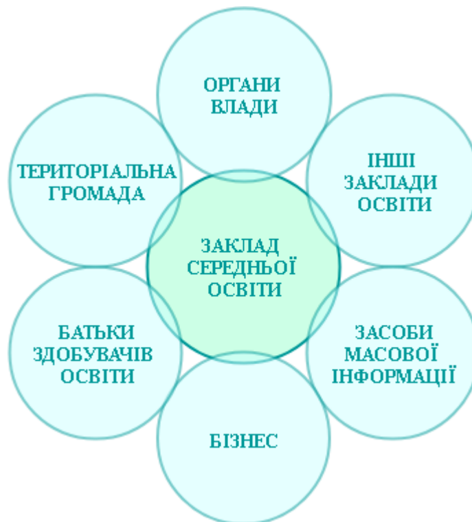
Рис. 2. Соціальні партнери закладу середньої освіти

Загальноприйнятим є розуміння партнерів школи як сторін, суб'єктів, організацій чи осіб, яких має бути як мінімум двоє(див. Рис. 2). Вони виходять зі своїх інтересів, мають ресурси для здійснення спільної діяльності та очікують на її результати, які є запорукою стійкого й успішного партнерства[54].