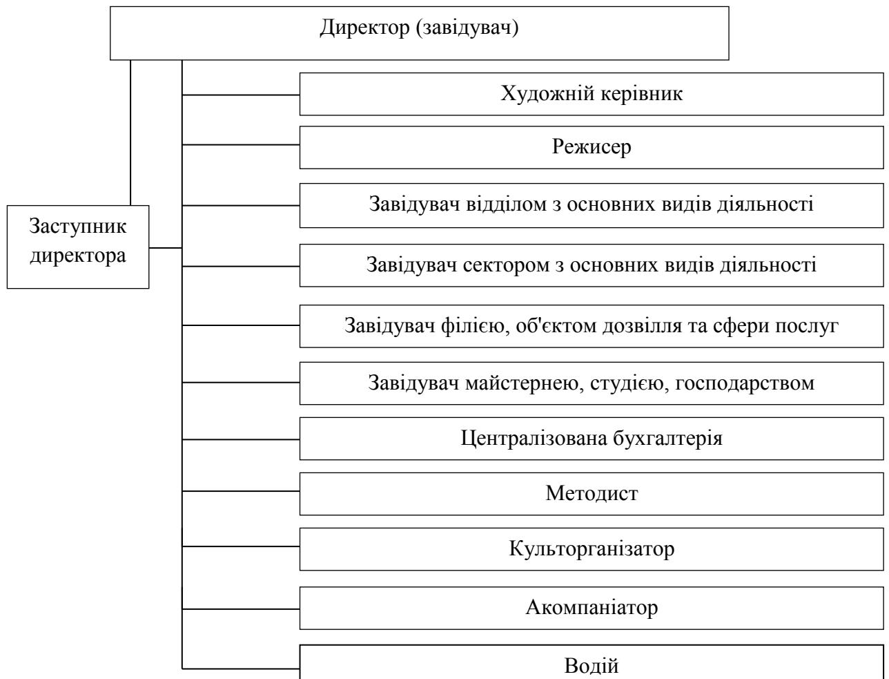
Рис.2.1. Організаційна структура Житомирського будинку культури [28]