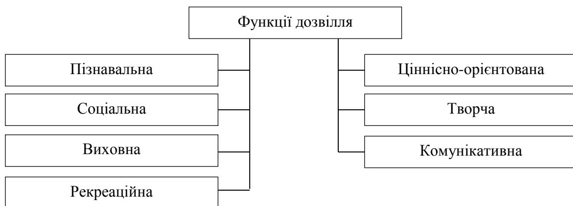
Рис. 1.1. Взаємозв'язок основних функцій дозвілля [4]

Аналіз напрацювань мелітопольського педагога з коледжа культури і мистецтв В. Білоконя [3] дав змогу виокремити головні чи найбільш типові функції дозвілля (рис.1.1).