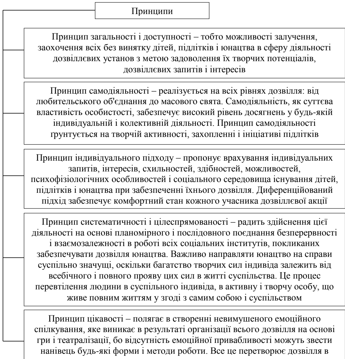
Рис.1.2. Принципи організації дозвіллевої діяльності [33, с. 118]

Таким чином, культурно-дозвіллева діяльність – це такий вид культурної діяльності, яка здійснюється, як правило, у формі аматорства (самодіяльності) у вільний час, є цілком самоврядною, а її продукти мають переважно некомерційний характер. Специфіка організації вільного часу – один із найважливіших показників рівня соціального розвитку суспільства.