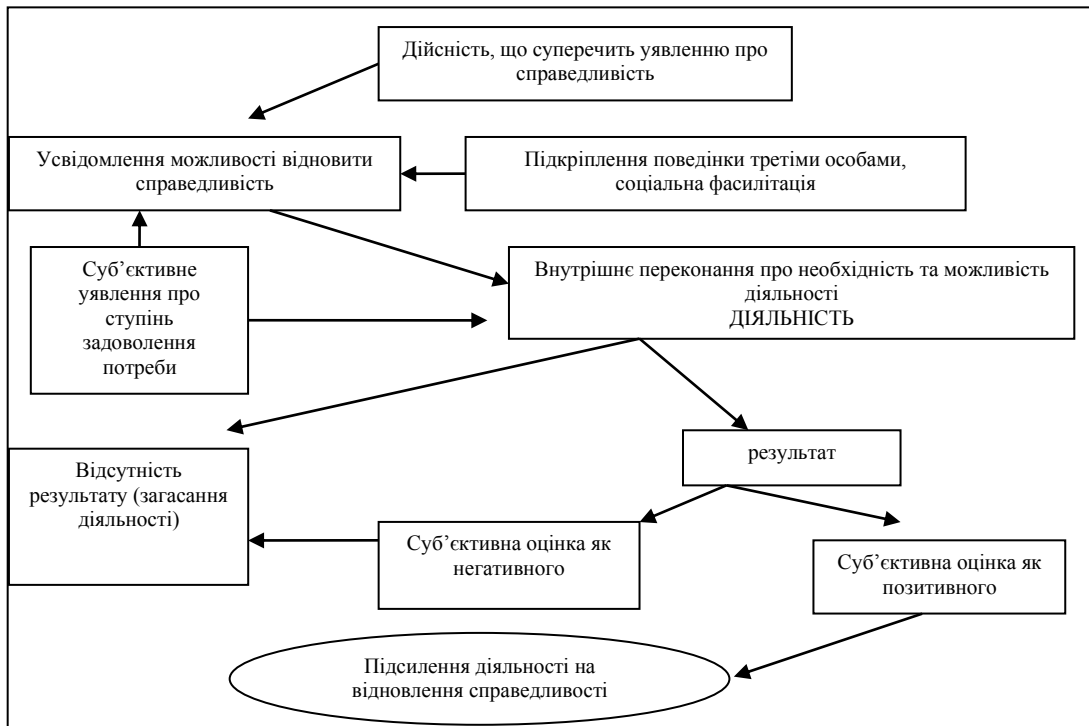
Рис. 2. Умови виникнення поведінки на відновлення справедливості

відновлення справедливості шляхом застосування примусу. Конвенціональний рівень у даному сенсі є перехідним, тому для конструктивного відновлення справедливості потрібно докладати зусилля, як правило, така місія лягає на законодавчі, судові, правоохоронні та виконавчі органи влади. Їх діяльність відображає рівень моралі, свідомості, правосвідомості та справедливості на макрорівні.